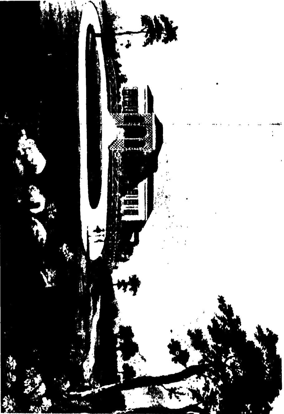
تريفورد هاوزس، مقر إقامة نابليون في سانت هيلين.